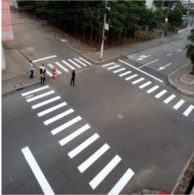
COOP. LOS HELECHOS